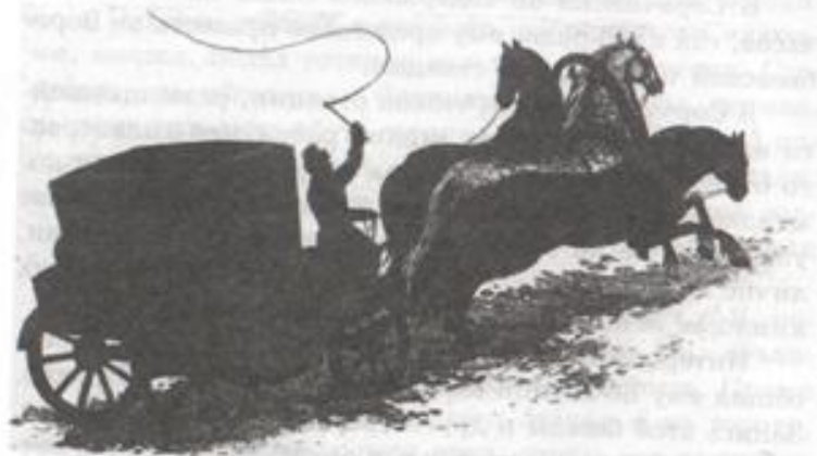
Поэт в пути

нем взамен просторных улиц и хат с кленами да вишнями под окнами чернеет поле, которое по осени колосится спелыми хлебами. Исчезла эта деревня в пору ликвидации "бесперспективных" сел.